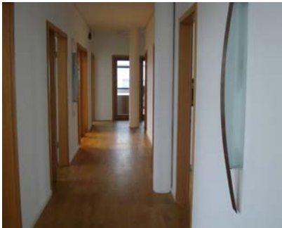
Flurbereich 7. OG