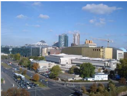
Ausblick 7. OG auf den Potsdamer Platz