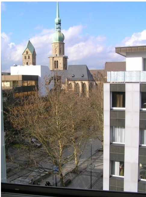
Blick vom 4. OG auf die Reinoldi - Kirche